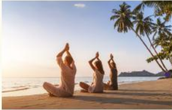
Creative and Lifestyle (Wellness)