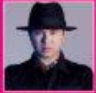
คุณเทพวรรณ คณินวรรณ CEO WITH ZAP PARTY