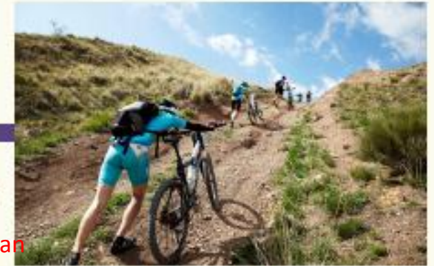
Sport and Mass Participations

พื้นที่ยุทธศาสตร์และเทศกาลที่เหมาะสมสำหรับท้องถิ่นในจังหวัดเพชรบุรีและประจวบคีรีขันธ์