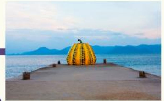
Art & Culture Events