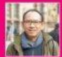
คุณผดุง ไพฑูริย์วาทย์ ศิลปินร่วมสมัย ศิลปินแห่งชาติ ปี 2558 และศิลปินแห่งชาติ สาขาศิลปะการแสดง (ดนตรีไทย) ปี 2561

วันจันทร์ที่ 27 กันยายน 2564 เวลา 09.00 - 12.00 น.